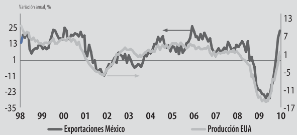
Fuente: Banamex con datos de INEGI y la Reserva Federal de EUA