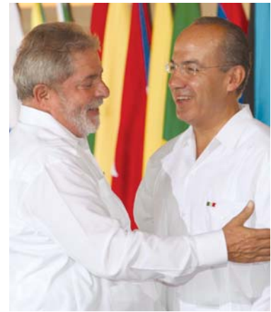
Luis Inácio Lula da Silva, presidente de Brasil y Felipe Calderón, presidente de México.

El proyecto "Etileno XXI", que se estima entre en operación en 2015, permitirá incrementar la producción nacional de estos insumos y reducir las importaciones de polietileno por un valor cercano a los 2 mil millones de dólares anuales, lo que tendrá un impacto significativo en la balanza comercial del país con Brasil, informó ProMéxico.