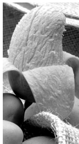
Propuesta varada desde 2006.

Canacintra sostiene que algunas de las dificultades más grandes para el sector mueblero, además de la competencia desleal, es una política inadecuada en materia forestal y la falta de apoyos económicos por parte del gobierno.