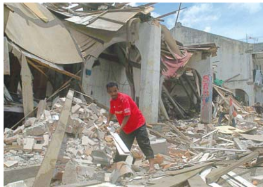
En 2009 se importaron sólo 11.5 mdd.

De acuerdo con el Colegio de México (Colmex), las relaciones económicas con Haití han sido muy débiles. Incluso, datos del Banco de México (Banxico) demuestran que las Antillas es la región de América con la cual menos intercambio comercial existe, al representar menos de 1% del comercio exterior que se genera con el continente, y en él, este país es el sexto con el cual México mantiene una relación.