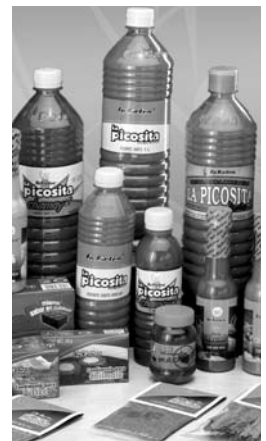
Producen 2.6 millones de salsas al año.

Actualmente, La Extra cuenta con una producción anual de poco más de 2.6 millones de botellas de salsas habaneras, mil 200 toneladas de condimento de achiote, y dos mil 400 toneladas de la salsa para batatas "La Picosita" elaborada a base de chile de árbol. En ese sentido, Castellanos García comentó que la calidad de su trabajo es lo que les ha permitido fortalecer su posicionamiento y permanencia en el mercado.