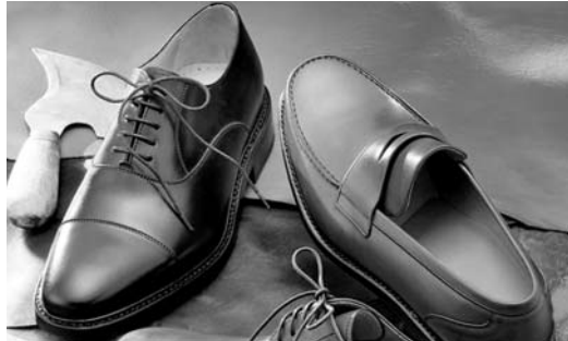
Fabricarán 240 millones de pares de zapato al final de año

Entre los elementos que considera Prospecta está el desarrollar las capacidades de las empresas en materia tecnológica, innovación, procesos productivos, moda, diseño y comercialización, todo ello soportado en actividades de inteligencia competitiva de la cadena