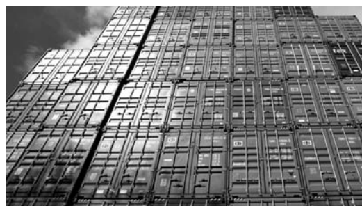
Argentina encabeza la lista en Latinoamérica.