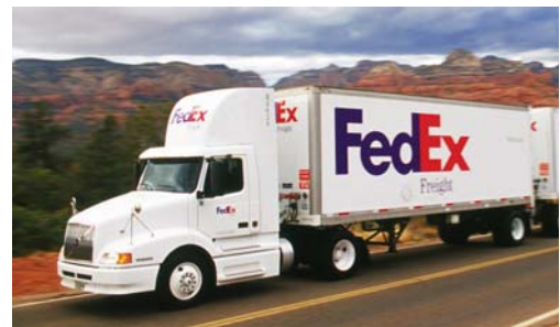
Suman unas nueve mil empresas.