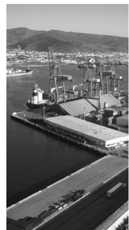
Pierde terreno con Latinoamérica.

/1 El dato corresponde al acumulado enero - agosto