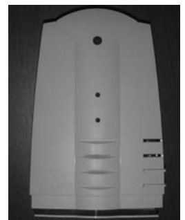
Encuentra nicho en escuelas y empresas.

Uno de sus proyectos es realizar un mapa de los riesgos que pueden afectar a las ciudades, para enviarlo a Protección