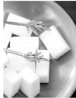
120% ha incrementado su precio.

De acuerdo con el Sistema Nacional de Información e Integración de Mercados (SNIIM), durante la semana en