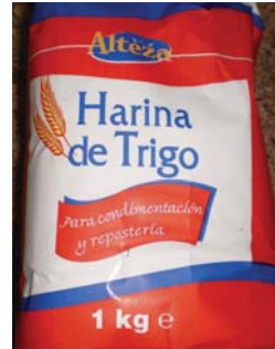
Solicitan industriales de la harina.

A través de la Comisión Federal de Mejora Regulatoria (Cofemer), la Cámara Nacional de la Industria Molinera de Trigo (Canimolt) refiere su preocupación por enfrentarse a una nueva norma de etiquetado que contiene variaciones a lo que establece la NOM-247, ésta última que entrará en vigor a partir de 2010, en tanto que la primera podría comenzar su vigencia antes de esa fecha, lo cual implicaría