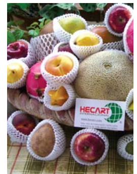
Malla protectora de fruta.

Además del Kulgard, Hecart comercializa una malla calcetín protectora para fruta, especialmente para mango, que cuenta con todas las especificaciones a las que obliga el mercado japonés, uno de los más exigentes en materia de calidad en las exportaciones de alimentos; así