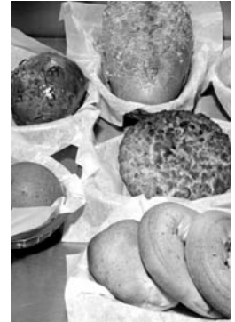
Depredación en mercado panadero.

El sector panificador independiente cuenta actualmente con 27 mil establecimientos a nivel nacional, y genera más de dos millones de empleos indirectos. En 2008, se estima que el país consumió 4.5 millones de trigo, lo cual en su mayoría fueron destinados a este sector.