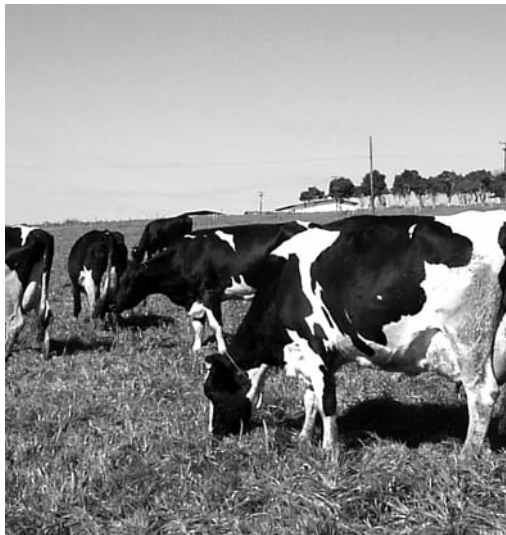
Falta de forraje repercutirá en precio de la carne.

El objetivo de los ganaderos es que el Gobierno Federal, a través de Sagarpa, no solo implemente medidas para atender la contingencia, sino que establezca un programa para apoyar las prácticas agrícolas que sirven a la ganadería, a fin de evitar situaciones futuras. Garza añadió que para los engordadores, el problema es el agua y el forraje, ya que el acceso a granos está garantizado, pese a que tampoco se está registrando una buena cosecha, a través del programa de coberturas gubernamental.