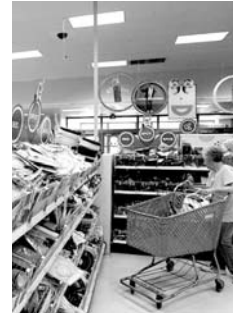
Segunda caída consecutiva.

46.6 PUNTOS ÍNDICE DE CONFIANZA DEL CONSUMIDOR