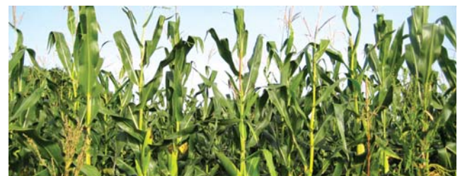
Algodón, soja y maíz serán los primeros.

Por su parte, Cárdenas sostuvo que el uso de transgénicos es una de las herramientas para garantizar la seguridad alimentaria en el país, ya que estos cultivos incrementan la productividad, además de que necesitan menos recursos hídricos y son más resistentes a las plagas. “La biotecnología es pilar en países desarrollados para asegurar la seguridad alimentaria”.