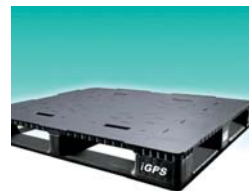
Reutilización de 175 millones de pallets.

"Cuando formamos iGPS en el 2006, nuestro modelo de negocios era de ofrecer a la cadena de suministros el pallet más innovador a nivel mundial, acompañado por servicios clave de apoyo de las mejores compañías. Las ventajas para nuestros