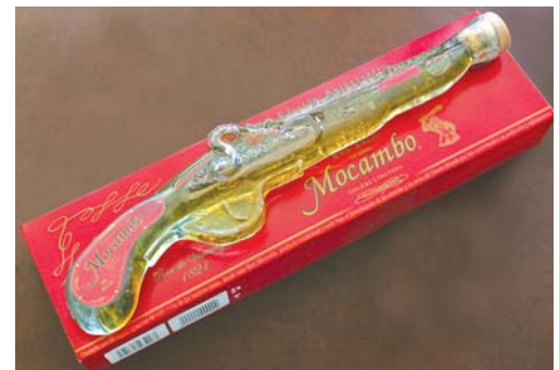
Pistola Mocambo 1821.

Ésta es la única pieza que ha sido elegida unánimemente por el jurado que otorga cada año el premio “World Star” en el marco de la reunión de la Organización Mundial del Empaque (WPO). En este caso, la botella “20 Años” del ron Mocambo en su presentación “Edición Arte”, fue galardonada el año antepasado en Grecia.