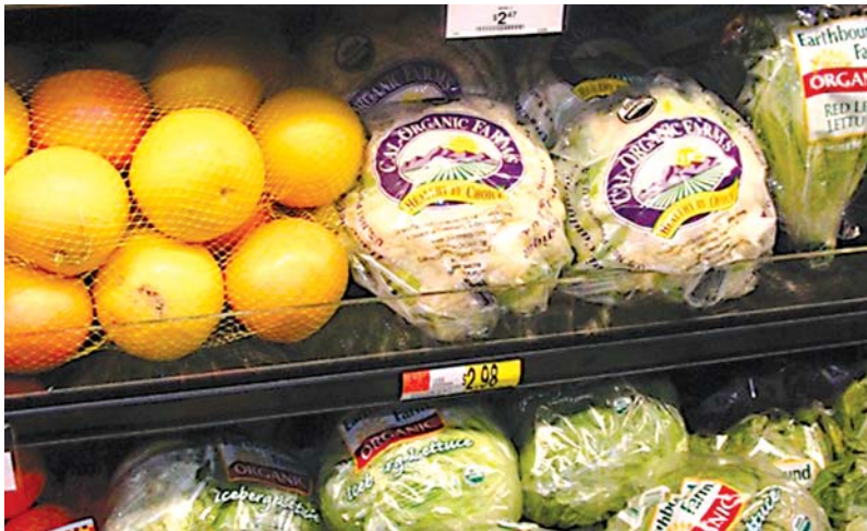
Atractivos diseños son factor de compra en la elección del cliente.

Exige envases y empaques menos coloridos