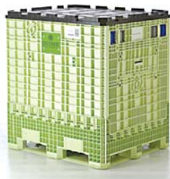
Controla temperatura por 5 días.

La empresa estadounidense Greenbox Pallet Shipper desarrolló un tipo de pallet de ambiente controlado que permite mantener la temperatura adecuada de los productos durante cinco días, a través de la tecnología PureTemp, desarrollada por la firma Entropy Solutions.