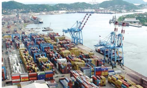
Exportan fruticultores chilenos a México para mercado local y a otros países.

denses, donde operan terminales de gran envergadura que por lo mismo privilegian el atraque de embarcaciones con escalas directas y grandes volúmenes, en México nos es posible llegar con una menor can-