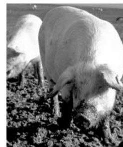
Baja de 21 a 15 pesos kilo porcino.

Resolución final del procedimiento de revisión de las cuotas compensatorias impuestas a las importaciones de hongos del género agaricus originarias de China, provenientes de Calkins & Burke Limited.