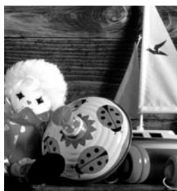
Lanzan campaña Aprobando y regalando.

Aún con este comportamiento, la perspectiva para cierre de año se mantiene en terreno positivo en donde se espera que este sector crezca en 0.6% afirmó el directivo, cifra que se encontrará por debajo de los resultados en 2008, en donde se avanzó 3.4% en lo que corresponde a tiendas iguales, es decir, los establecimientos que operaban hasta el año precedente, y en donde no se consideran las nuevas aperturas.