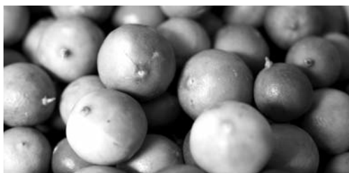
El limón se mantiene en los primeros lugares.

Según el reporte, los productores mexicanos ocupan el primer lugar mundial como productores de limón de la variedad "mexicano" y segundo