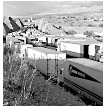
El comercio bilateral tiene un valor de 367 mmd.

La firma de esta Carta de Intención entre Carstens y Napolitano vendrá a fortalecer la cooperación aduanera entre México y Estados Unidos, tal como lo acordaron en abril pasado los presidentes Felipe Calderón y Barack Obama.