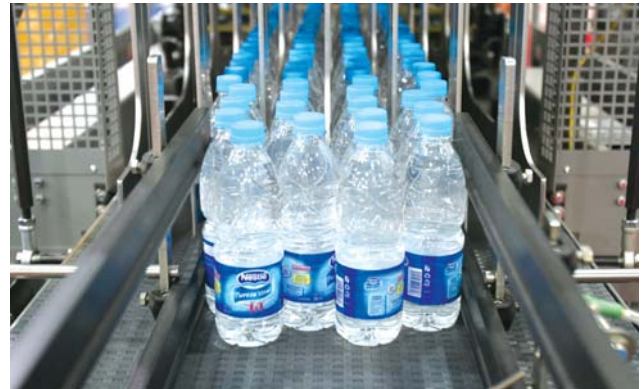
La muestra conjuntará empresas de más de 20 países.