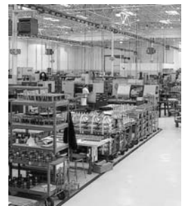
El sector ha caído 6 meses continuos.

pesos, mientras que la implantación y certificación de normas y requisitos internacionales se eleva de 100 mil a 150 mil pesos.