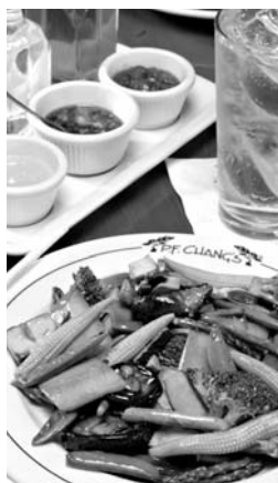
Legua restaurante de comida china.

resto del país fue en promedio del 10% la caída de las ventas, a pesar de que al inicio de la alerta sanitaria se observó un ligero aumento derivado de las compras de pánico.