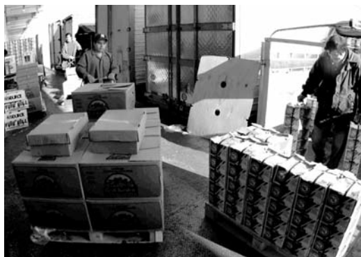
Ciudad de México y Cancún los más afectados.

En Gómez Palacio, Durango, la disminución fue del 10% de las 60 toneladas de diferentes productos alimenticios que se expendían; mientras en Monterrey la caída se ubicó en 30%; en tanto en