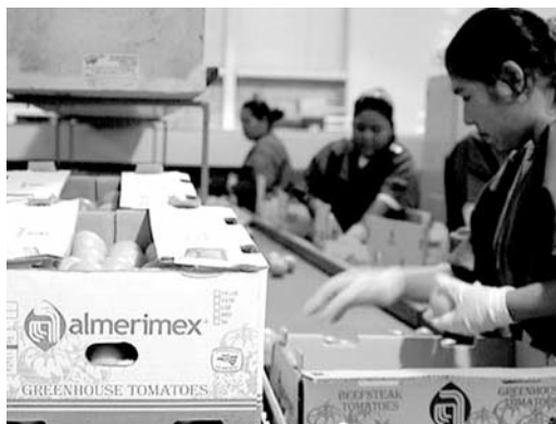
Alcanza 125 has. de producción de hortaliza en invernadero.

El cultivo bajo invernadero es una industria al alza, pese a que requiere