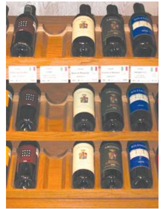
Arancel desmotiva importación de vinos.

De este modo, estas bodegas pretenden aumentar paulatinamente su presencia en el país, que está viendo cómo el consumo y la apreciación del vino crece año con año. "Todavía son cifras bajas, pero hay muchos habitantes y mucho potencial en este mercado".