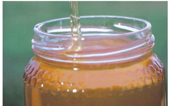
En dos años aumentó 75% el valor de las ventas internacionales de miel.

Estas cifras evidencian la magnitud del problema, explicó Galindo, ya que aunque se están llevando a cabo programas de verificación de marcas junto a la Procuraduría Federal del Consumidor (Profeco) y ya se han retirado algunas del mercado, esta miel "pirata" continúa siendo accesible para el consumidor. "Es muy difícil identificar a la vista qué miel está adulterada. La forma de saber que es 100% pura es ver el holograma del Consejo Regulador. La miel no es barata. La que se vende a bajo precio, seguramente, es porque no es miel".