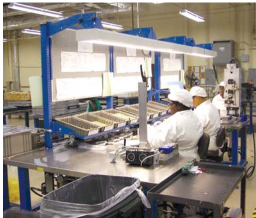
Elimina México arancel a ciertos productos usados.