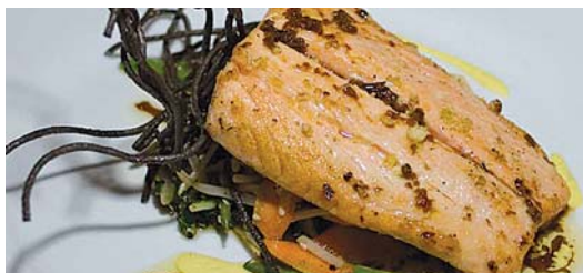
Productores nacionales exportan por mejor precio.

México mantiene contra Estados Unidos una demanda ante la Organización Mundial de Comercio (OMC) por el bloque a la importación de atún. El problema deriva de que el vecino del norte no consi-dera como libre de captura incidental del delfín al pescado mexicano, comparativamente más barato, por lo que no le otorga la etiqueta de "delfín a salvo" que se requiere para poder comercializar el producto.