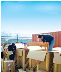
Signen 204 cuotas compensatorias.

La Cámara de Comercio y Tecnología México-China, en un comunicado avaló el