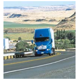
Alto costo del transporte.

Servimsa anunció la inversión para la construcción y puesta en marcha de una planta, en donde en una primera etapa