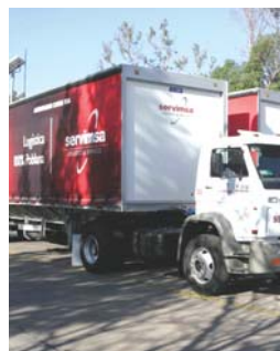
Cancela 150 millones de pesos.

Servimsa, empresa proveedora de servicios logísticos y de transporte de materiales productivos, anunció la suspensión de una inversión de 150 millones de pesos en el centro logístico "La Célula", máximo proyecto del gobierno de esa entidad.