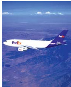
Ampliarán terminal aérea en Jalisco.

El presidente internacional de la compañía, Michael Duckert, dijo que para afrontar la crisis financiera mundial, la compañía implementó un plan de reducción de costos, entre cuyas acciones destacan la decisión, ante el menor volumen de carga, de aterrizar temporalmente parte de su flota aérea y la reducción de salarios a nivel ejecutivo. Sin embargo, advirtió, también están buscando áreas de oportunidad para nuevas inversiones, entre las que México se posiciona como una opción.