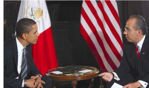
Barack Obama y Felipe Calderón.

Es por el escenario anterior que los especialistas descartan que el gobierno encabezado por Obama mantenga inte-