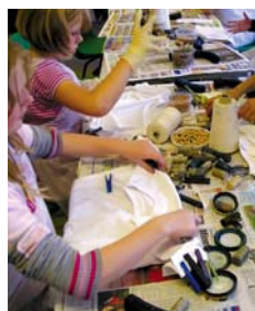
Apoyo a Pymes.

Sin embargo, el directivo reconoció que el crédito se encarecerá este año debido a que el costo de fondeo en el mundo ha aumentado por una mayor aversión al riesgo. "Trataremos de tener las tasas más competitivas posibles en este entorno. Pero hoy conseguir dólares le cuesta a Bancomext entre dos y tres puntos más que hace tres meses y eso se repercutirá a los clientes", advirtió.