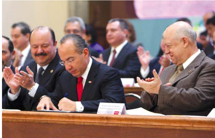
Garantiza gobierno 20% compras a Pymes.

En el tema de financiamiento, a través de Nafin y Bancomext se incrementará 21% los montos que se canalizarán a las Pymes, por lo cual ahora se dispondrá de