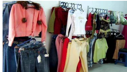
Contrabando, recesión y falta de apoyo a Pymes, principales retos.

"Para el 2009 el juego cambiará, tenemos que proteger el empleo y que la industria se mantenga. Estos cierres de empresas no serán totales, pero sí prevemos una reducción de los turnos laborales