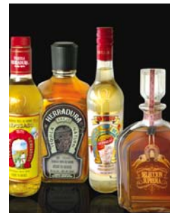
Crecen 2% ventas al exterior.

A pesar del comportamiento se tienen retos por delante, como es que los empresarios tequileros incrementen la exportación de sus marcas y productos, ya que hasta ahora del volumen exportado, 69