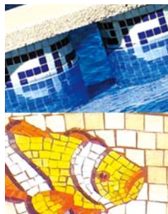
Fue pionera en América.

Venecianos, cuya principal marca es Kolorines, que pueden encontrarse sus diseños en el Grand Waile Hotel de Hawái, en el Metro de la Ciudad de Nueva York, en la piscina del Hotel Bellagio de las Vegas y en la Alberca Olímpica de Estocolmo, en Suecia.